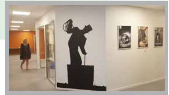
Målningar och fototavlor med sotaren skapar enhetlig inramning. Varumärkesbyggande gentemot besökaren – och bra för ”vi-andan”.