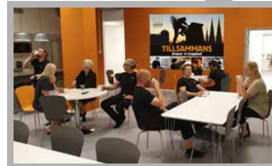
Nya matsalen – som också enkelt kan göras om till mötesrum.

Att jobba med en tydlig grafisk profil och enhetliga uttryck har varit en viktig del i Åke Huss satsning. “En genomarbetad bild av vårt företag skapar konkurrensstyrka – vi vill ju vara kundens naturliga förstahandsval. Men det är också bra för samhörigheten och stoltheten att jobba här. Förutom bilarnas dekor med den tydliga Uppsalasilhuetten, vill vi lyfta fram våra medarbetare i kommunikationen. Det ska vara lätt att känna igen oss – och lätt att lära känna oss”, kommenterar Åke.