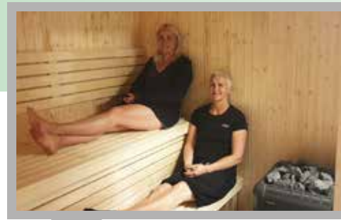
Män och kvinnor får varsin bastu – och gott om utrymme för omklädnad och förvaring.

– Med vår flytt tar vi därför också ett rejält grepp om jämställdheten. När vi ser om vårt hus och vårt sätt att arbeta, så kommer också allt fler att vilja hänga med oss på vår framtidsresa, avslutar Åke Huss. ■■