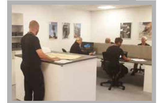
Nya teknikerummet med digitala hjälpmedel för arkivering.